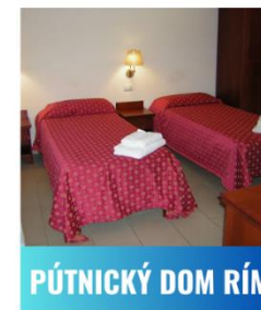
PŮTNICKÝ DOM RÍM